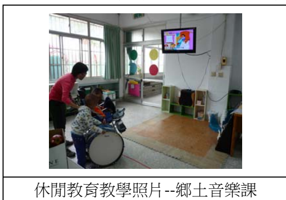
休閒教育教學照片--鄉土音樂課

當跟老師提起要討論教材教法的時候，老師僅說學生人數少，沒有使用什麼教材教法。老師有提及會以普通班教材一對一教導高組學生基本的聽說讀寫。