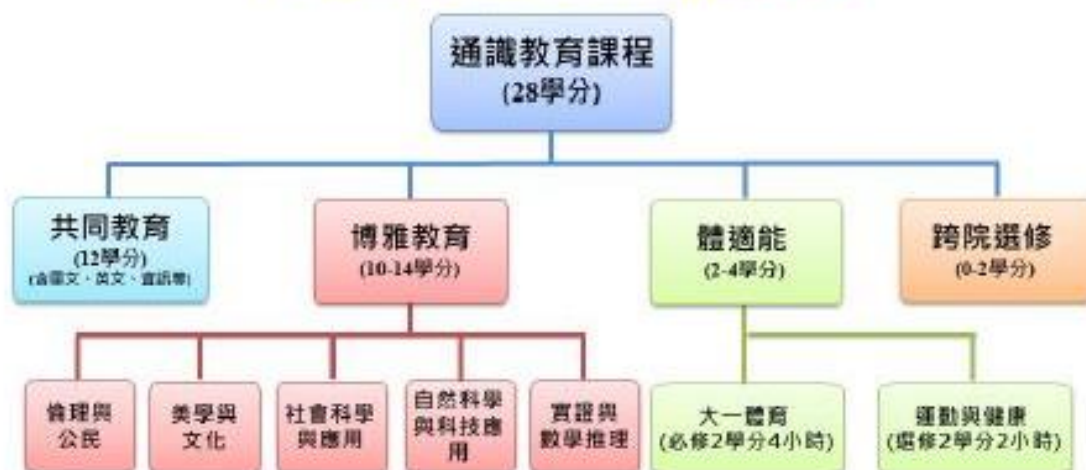
110學年度入學生通識課程架構圖(學士班)